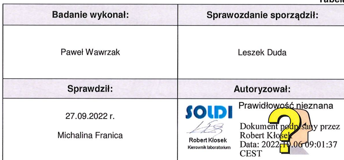
Tabela nr 6

Stwierdzenia zgodności dokonano na podstawie zasady podejmowania decyzji i wymagań zawartych w załączniku do Rozporządzenia Ministra Klimatu z dnia 17 lutego 2020 r. w sprawie sposobów sprawdzania dotrzymania dopuszczalnych poziomów pól elektromagnetycznych w środowisku [Dz. U. 2020, poz. 258, Dz. U. 2022, poz. 1121].