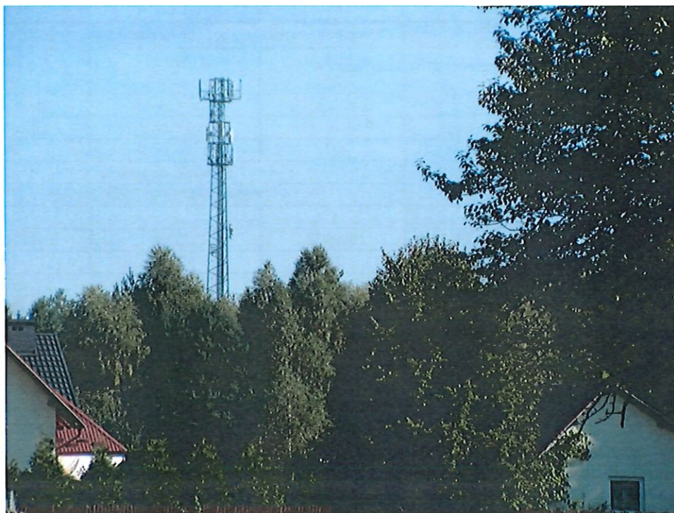
Fot. 1. Stacja bazowa telefonii komórkowej sieci TOWERLINK BT20817 Bojanów Orange - widok wieży antenowej