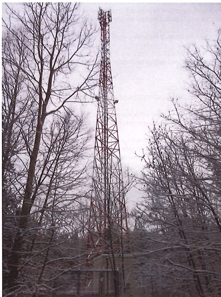
Zal. nr 1: Widok ogólny badanego obiektu.