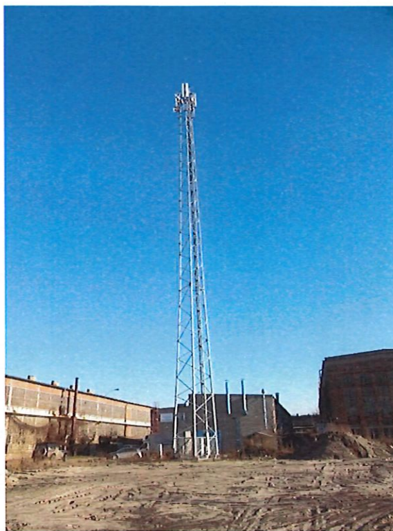
ZaŃ. nr 1: Widok oglny instalacji radiokomunikacyjnej.

Koniec sprawozdania. Sprawozdanie zawiera dodatkowo zaŃczniki nr 1 i 2.