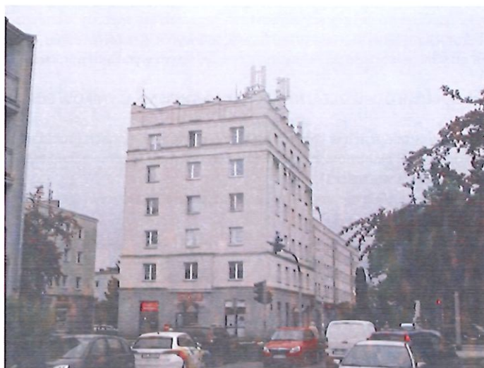
Zal. nr 1: Widok ogólny instalacji radiokomunikacyjnej.